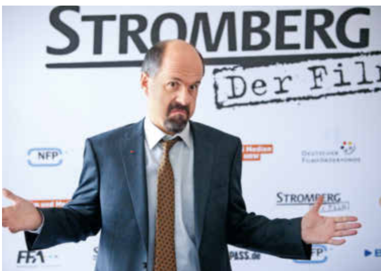
Der Kinofilm „Stromberg“ wurde durch 3.000 Kleinanleger ermöglicht.