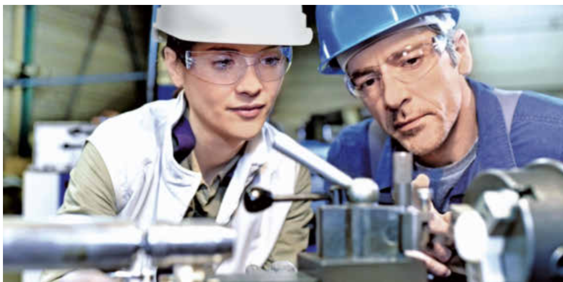
Nach nur 0,6 Prozent Wachstum in 2015 kam M+E auch 2016 nicht wirklich auf Touren: Drin ist wohl nur 1 Prozent.

Auch die Auslandskundschaft will nicht wirklich zugreifen – weder die in den Industriestaaten