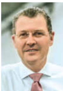
Nachgefragt bei Rainer Dulger, Präsident von Gesamtmetall