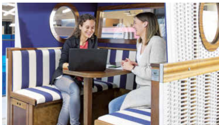
Hanseatisches Flair in der neuen Firmenzentrale von Philips.