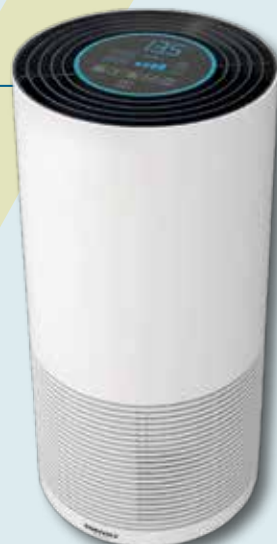
2.-5. Preis Luftreiniger mit Bluetooth